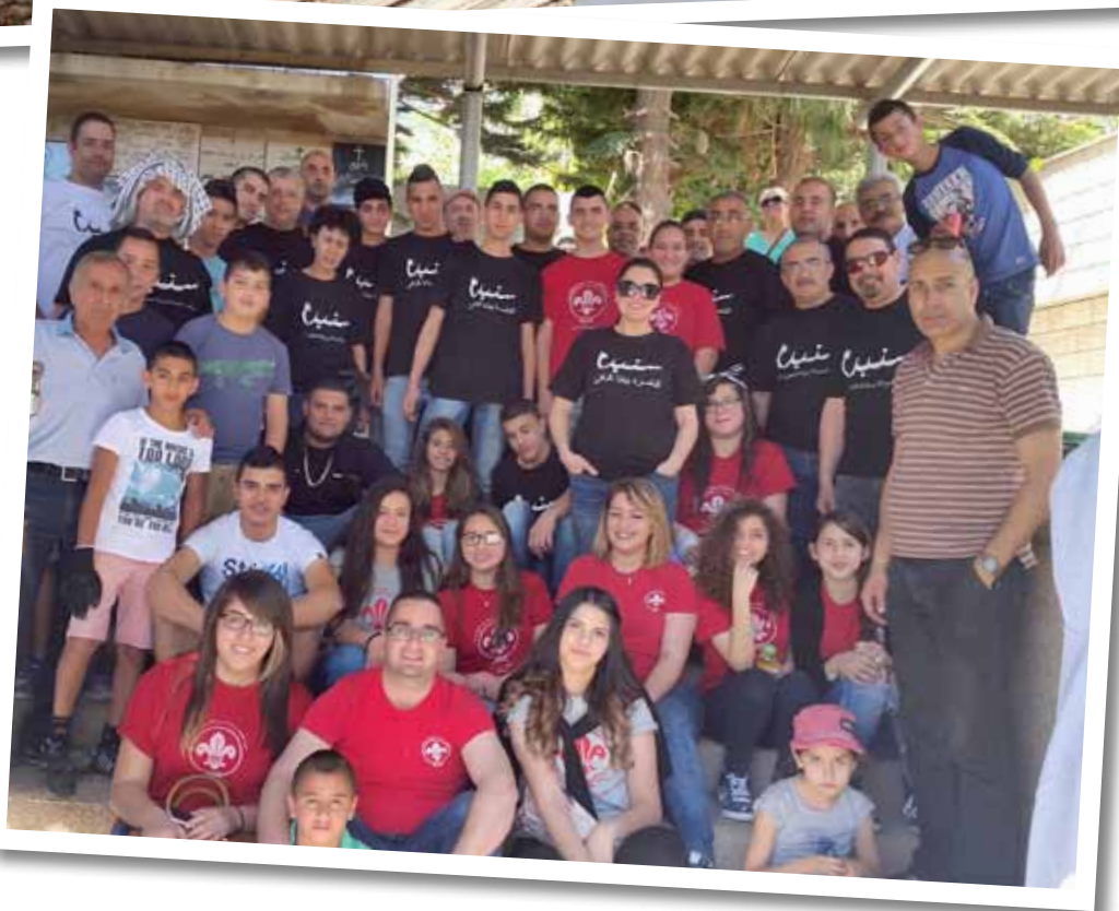
يوم عمل تطوعي في المدفن القديم، الأحد 17 نيسان 2016