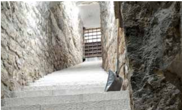
الدرج الداخلي بجانب النبّة المقدسة