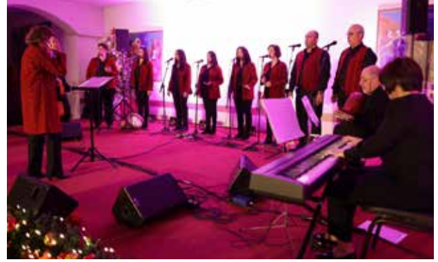
أمسية "نضوي القنديل" جوقة عود النّد