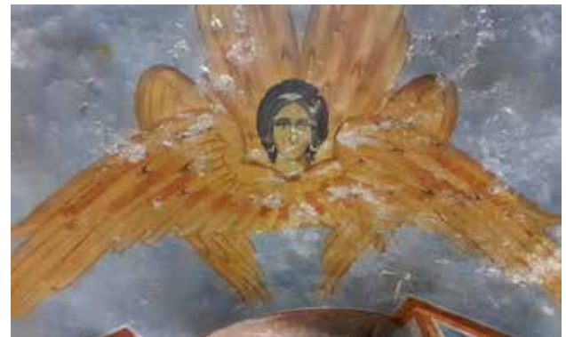
أيقونة السيرافيم تظهر عليها أضرار الرطوبة والتكسّس