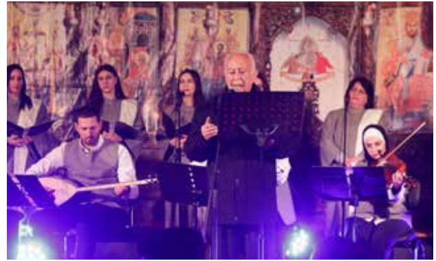
كونسرت الفصح "جوقة مرنمو المهد"