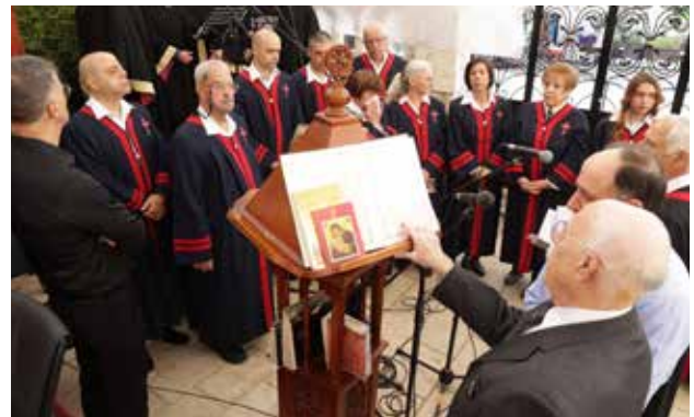
جوقة كنيسة البشارة الأرثوذكسية