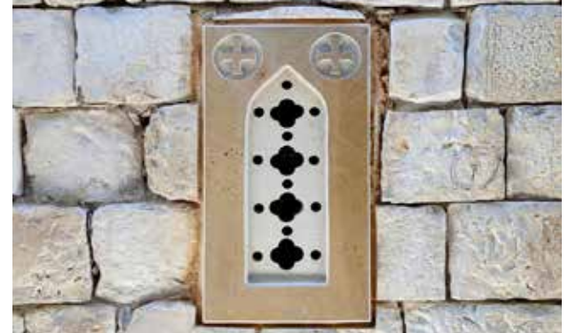
ترميم شبائيك الكنيسة