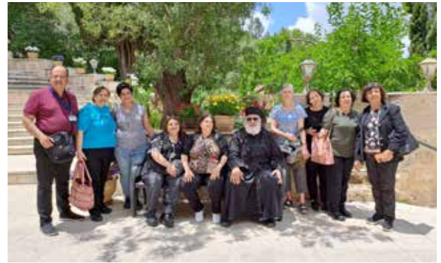
رحلات إلى الأماكن المقدسة