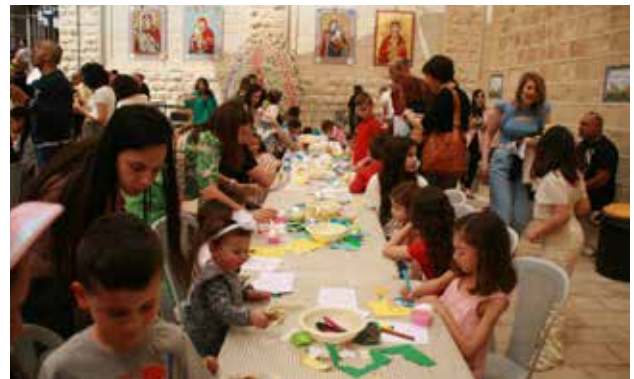
فعاليات الأطفال في موسم الفصح