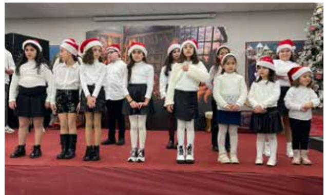
أطفال مدرسة الأحد في أمسية ميلادية