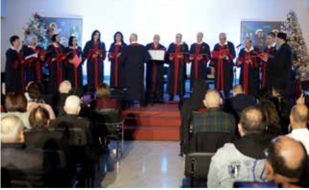
جوقة الكنيسة، أمسيات ميلادية