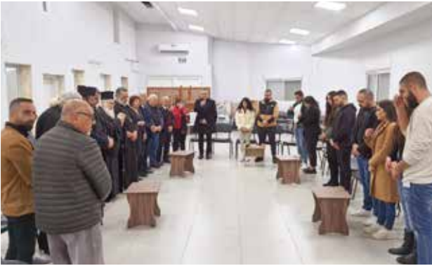
دورة الرباط المقدس