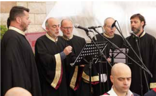
الجوقة اليونانية من جامعة أثينا