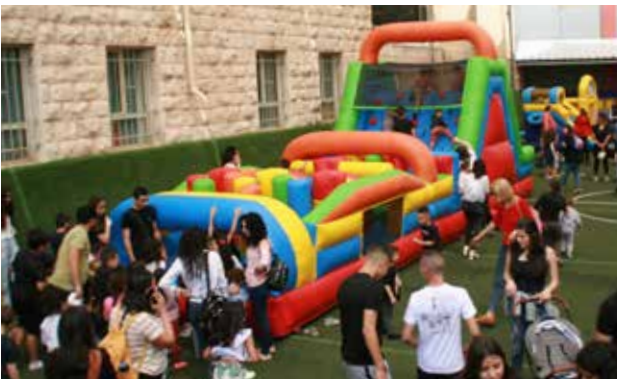
فعاليات الأطفال في موسم الفصح