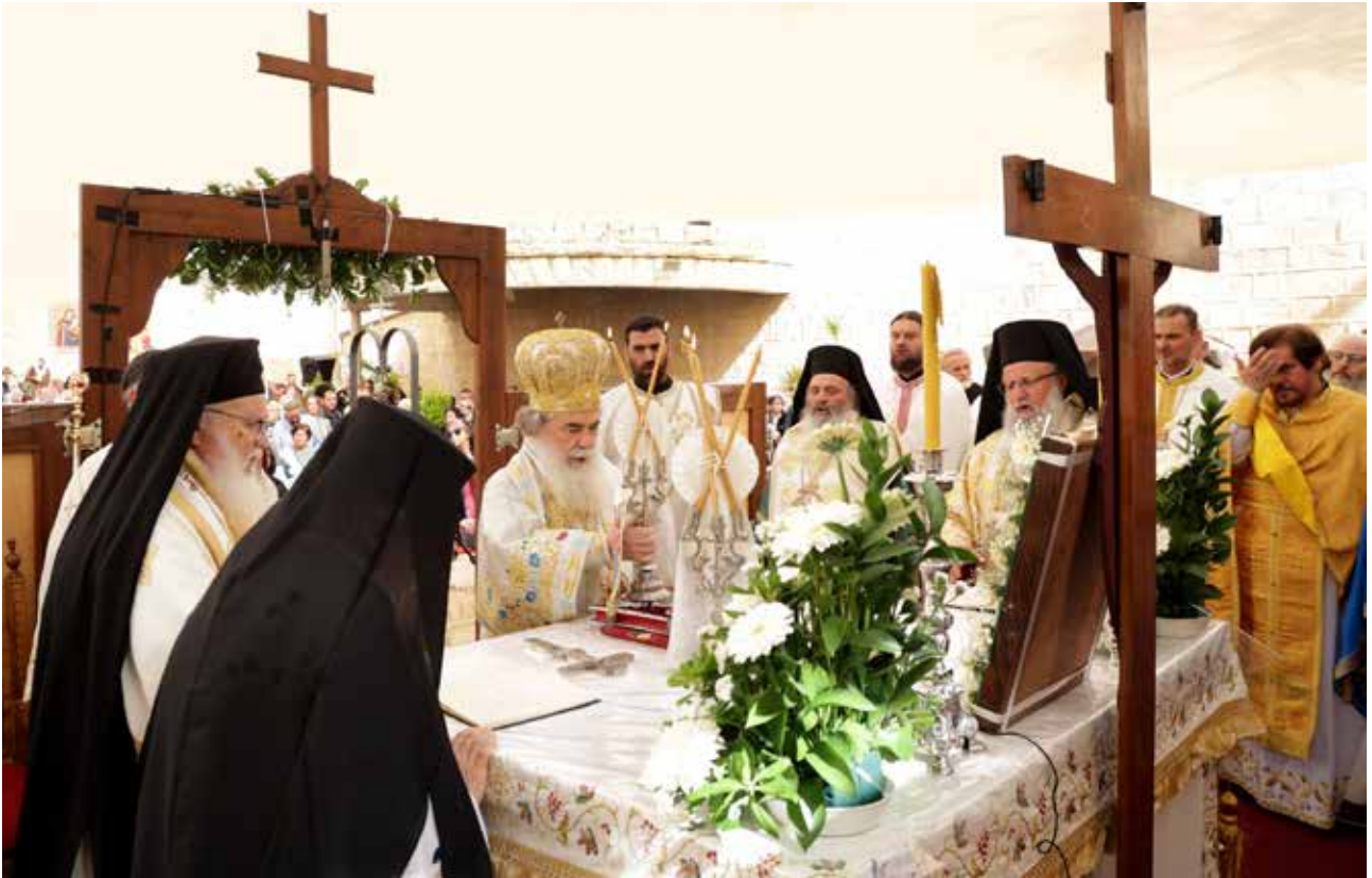
قداس عيد البشارة