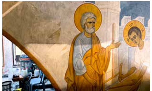
أيقونة السيد المسيح النجار، أيقونة نادرة وخاصة بكنيستنا عزل الطبقة السوداء عن الألوان