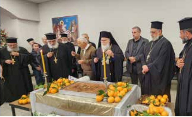
تقطيع كعكة رأس السنة وختان الرب