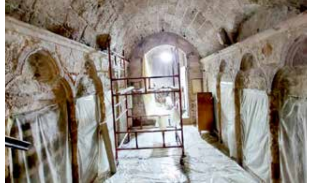
مراحل ترميم سقف وجدران المغارة