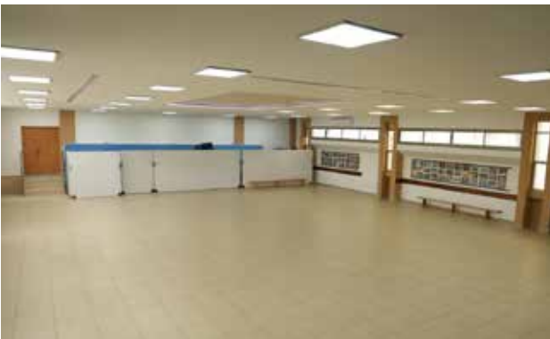
قاعة مركز الأحداث الأرثوذكسي