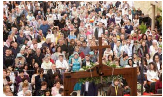
قداس عيد البشارة