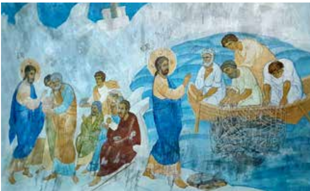
الوضع القائم لأيقونة أعجوبة صيد السمك في بحيرة طبريا سيتم ترميمها لاحقاً