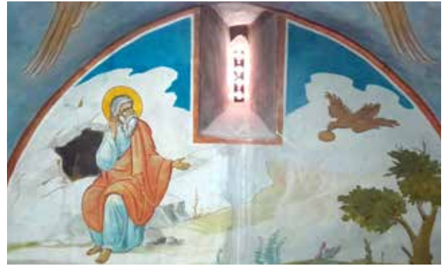
مراحل ترميم أيقونة النبي ايليا