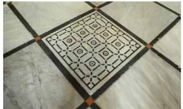
ترميم البلاط في الكنيسة