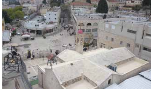
مبنى كنيسة البشارة الخارجي