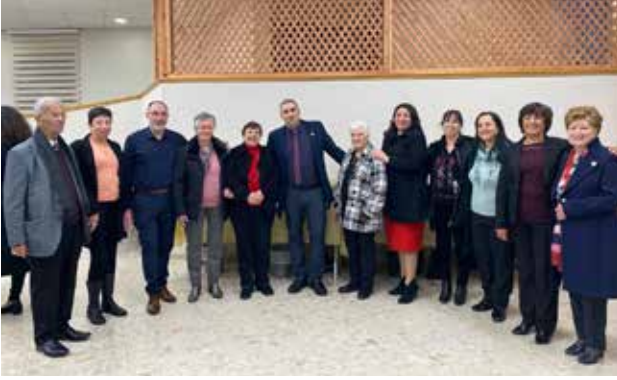
أخوية كنيسة البشارة