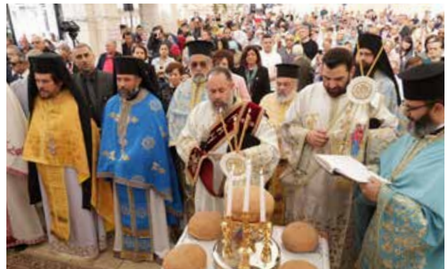
قداس عيد البشارة