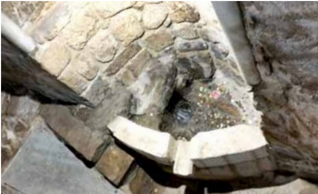
ترميم القسم الداخلي للنبع المقدس

بدأ المشروع الكبير بمعالجة الرطوبة التي أحاطت بكلّ الكنيسة. ورُمّت الشبائيك لتكتسي مظهرًا بيّنظي واستبدلت كلّ المكيفات الهوائية، ورُمّ بلاط الكنيسة وبرز جمال مبنى المغارة بعد ترميم مدخلها وسقفها والبلاط العثماني على جدرانها. وتحت أيقونة البشارة الكبيرة تمّ ترميم القسم الداخلي للنبع المقدس،