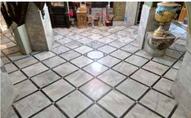
ترميم البلاط في الكنيسة