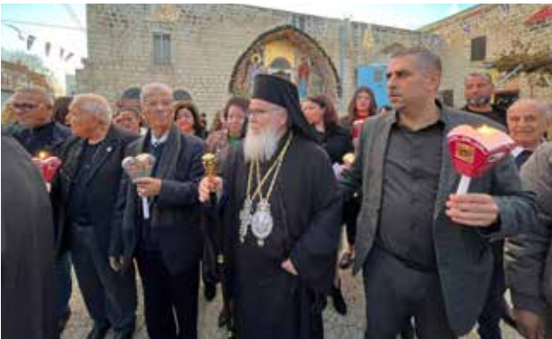
مسيرة الشموع الميلادية