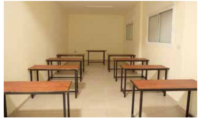
مدرسة ترميم الأيقونات