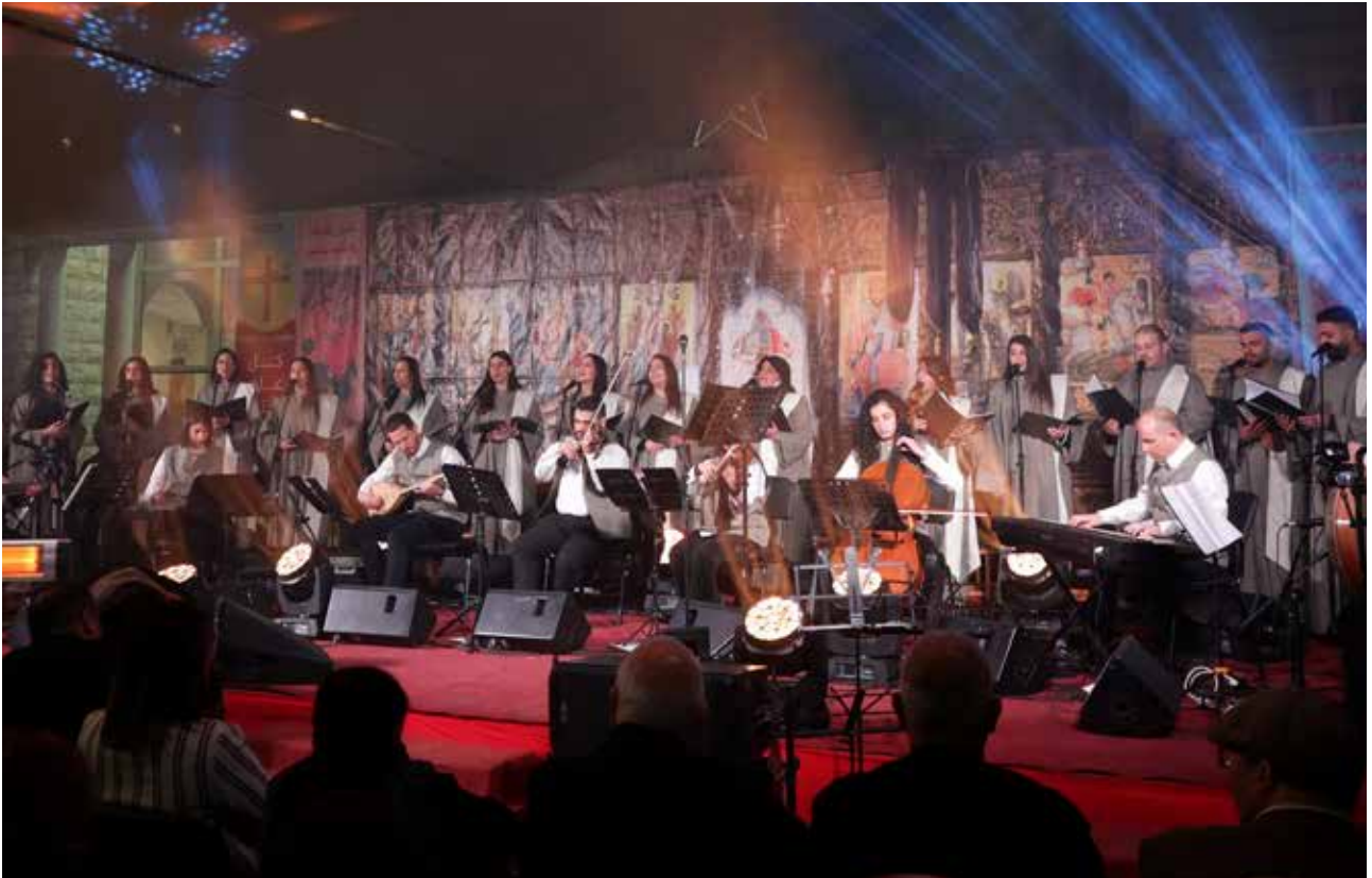
كونسرت الفصح "جوقة مرنمو المهد"