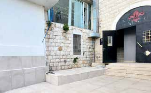
مدخل مبنى الكشاف