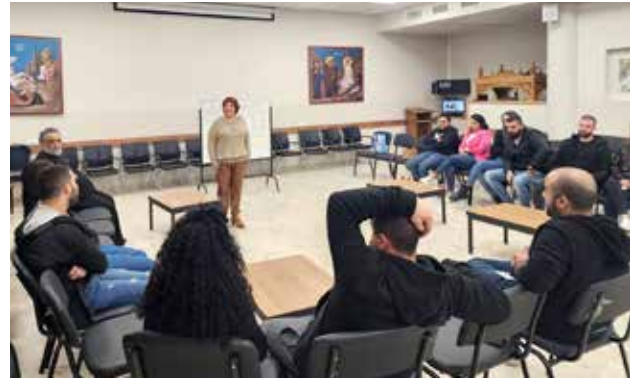
دورة الرباط المقدس