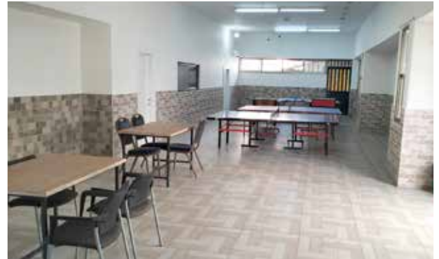
مدخل نادي مركز الأحداث الأرثوذكسي