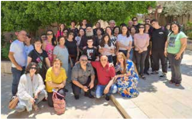
رحلات إلى الأماكن المقدسة