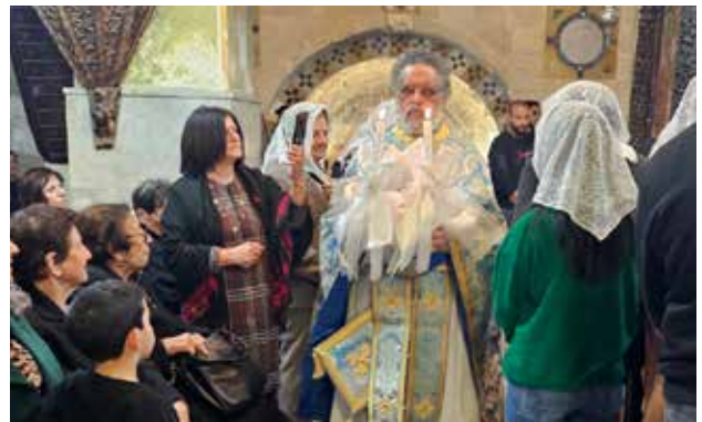
دخول الأطفال الصغار الى الكنيسة