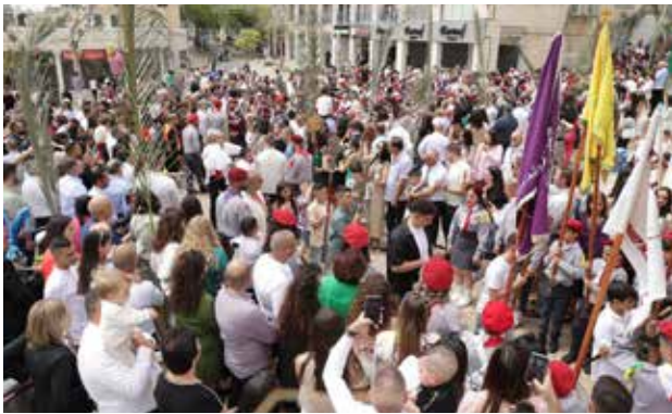
استعراض كشفي - أحد الشعانين