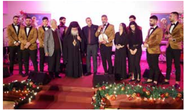
"تراتيل وتأملات ميلادية" فرقة أمسيات