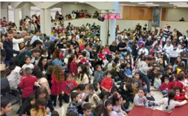
فعاليات الأطفال في موسم الميلاد