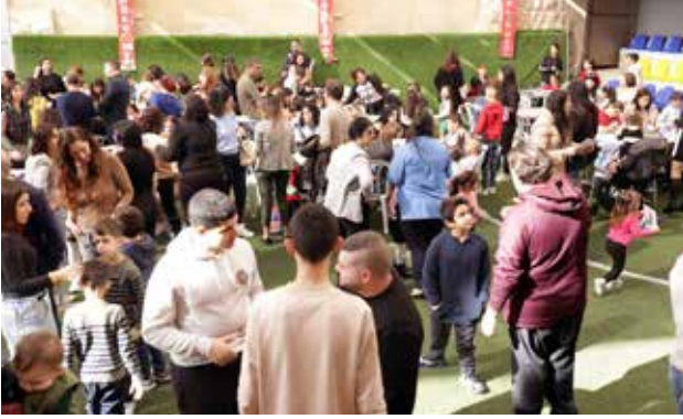
فعاليات الأطفال في موسم الميلاد