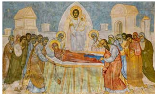
أيقونة رقاد والدة الإله مريم في المراحل الأخيرة من الترميم