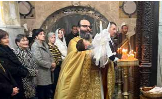
دخول الأطفال الصغار الى الكنيسة