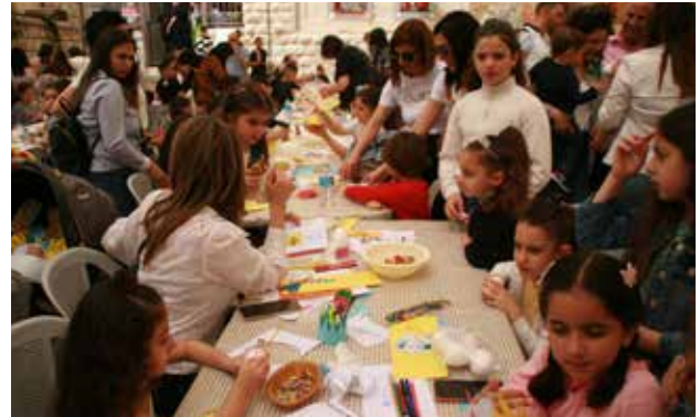
فعاليات الأطفال في موسم الفصح