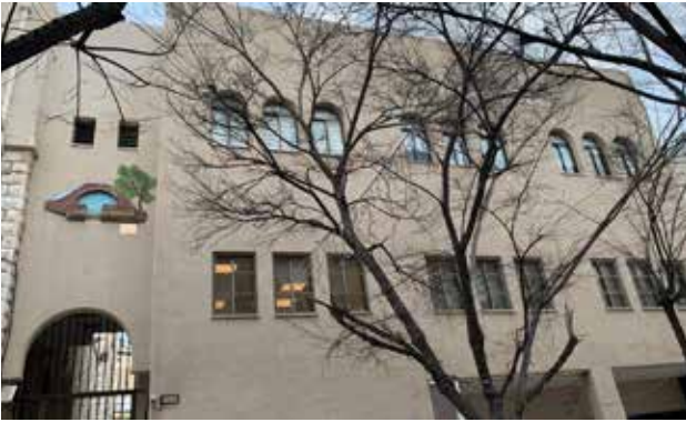
بناية عين العذراء (عمارة البلدية سابقا) من الخارج