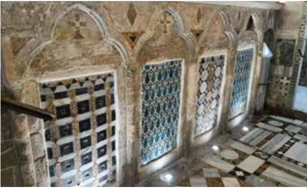
ترميم جدران المغارة