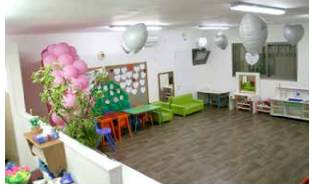
صف جديد في الحضانة