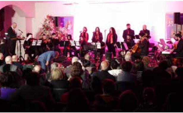
كونسيرت "مناجاة الروح" فرقة ترشيحا