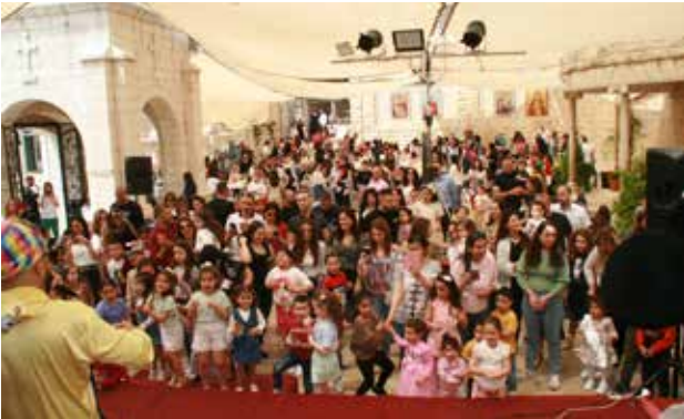
فعاليات الأطفال في موسم الفصح