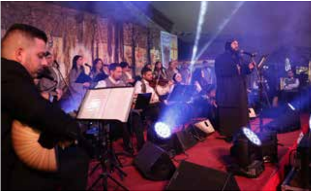
كونسرت الفصح "جوقة مرنمو المهد"