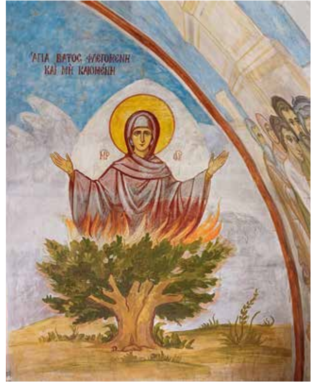
أيقونة العليقة المشتعلة بعد الترميم