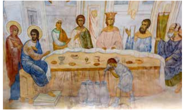
ترميم باطني للطبقة الجيرية - أيقونة عرس قانا الجليل