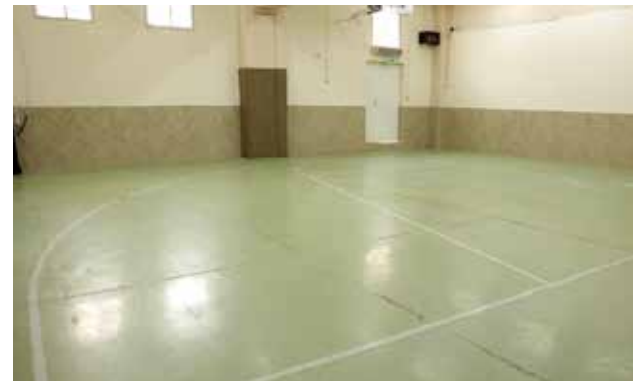
القاعة الرياضية التحتى