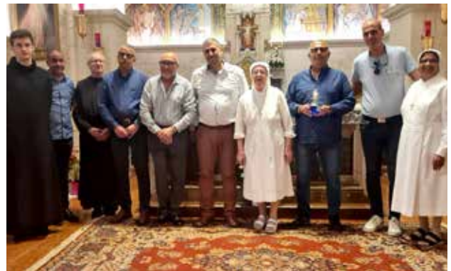
توزيع النور المقدس لمستشفى العائلة المقدسة