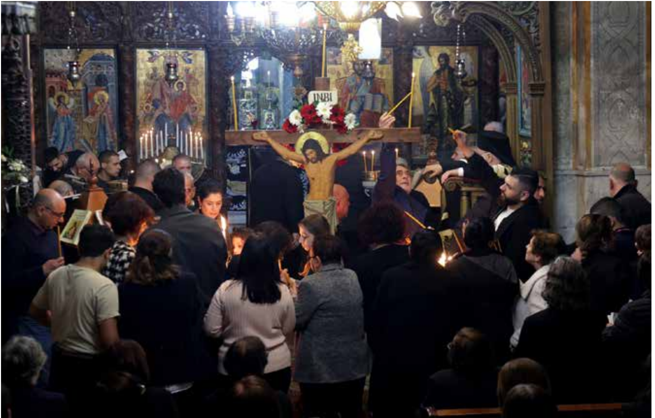
خميس الأسرار - قراءة ال12 إنجيل