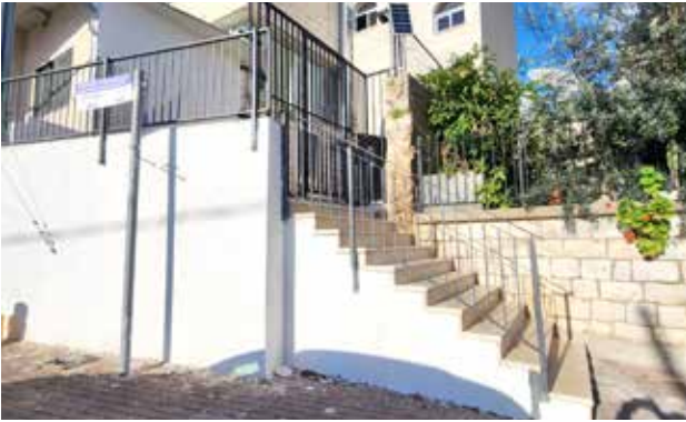
مدخل مبنى الكشاف