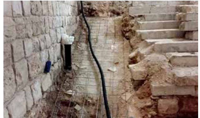
معالجة الرطوبة في محيط الكنيسة