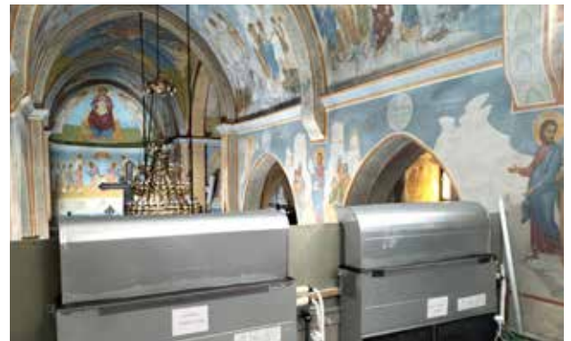
استبدال كل المكيفات الهوائية