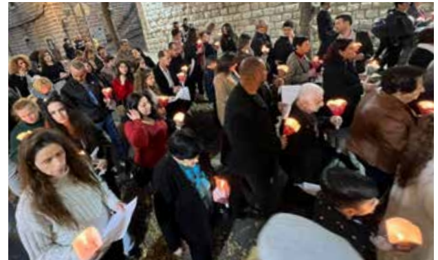
مسيرة الشموع الميلادية