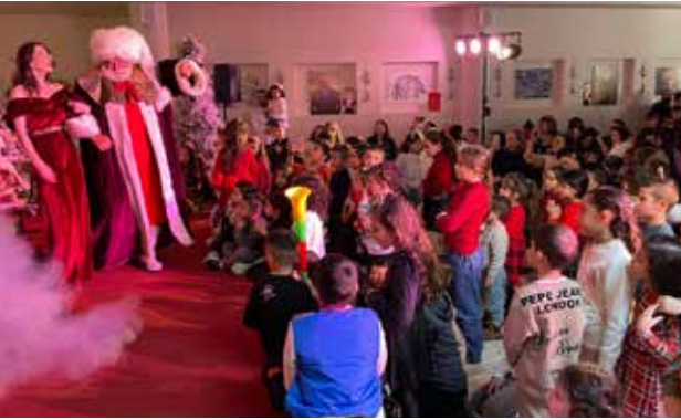
مسرحية "سحر الميلاد"