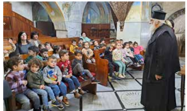
زيارة أطفال الروضة للكنيسة