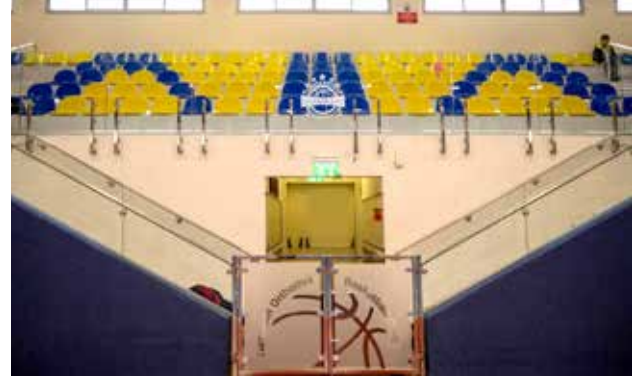
درج قاعة كرة السلة