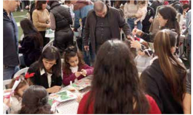
فعاليات الأطفال في موسم الميلاد