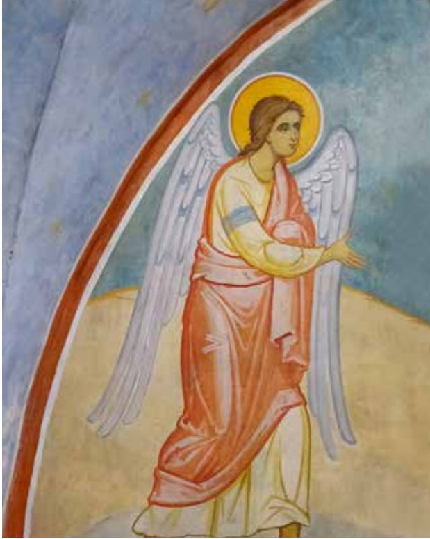
أيقونة ملاك الرب بعد الترميم

ما نقوم به جدّاً حسّاس ويتطلّب المعرفة الكاملة والخبرة، لنواجه جميع المشاكل المرئية وغير المرئية، مثل ضعف الميكانيكية للون وتلف طبقة الشيد العميقة والخارجية، وهذا العمل المتواصل