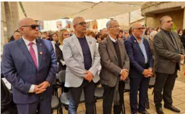
قداس عيد البشارة