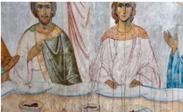
مقطع من أيقونة عرس قانا، تظهر عليها ترسبات مائية