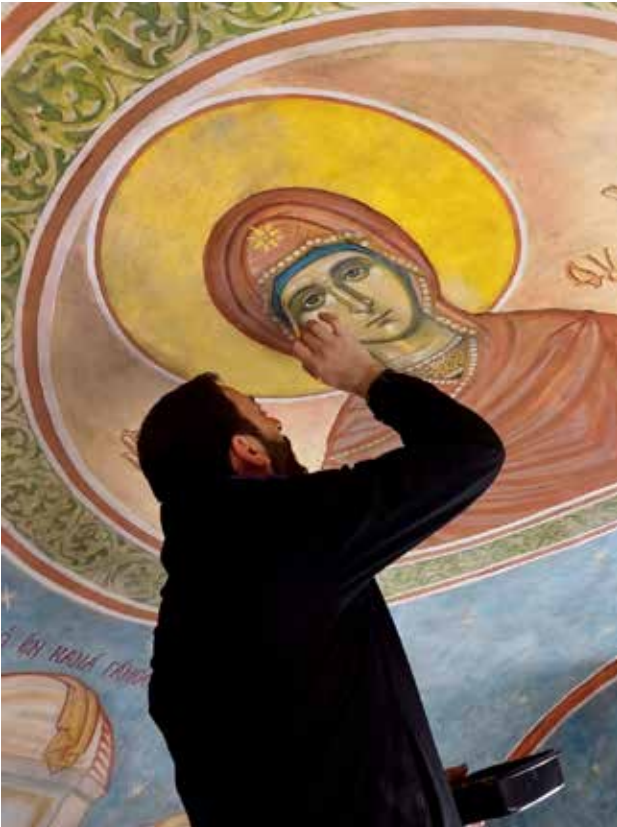
ترميم الألوان الترابية لأيقونة والدة الإله مريم العذراء