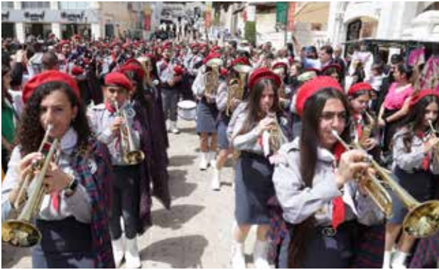
قداس عيد البشارة