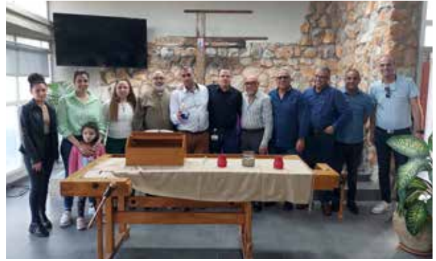
توزيع النور المقدس لمستشفى الناصرة