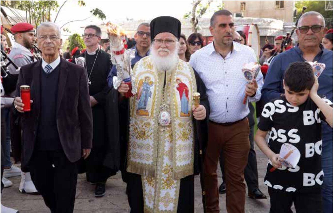
استقبال النور المقدس