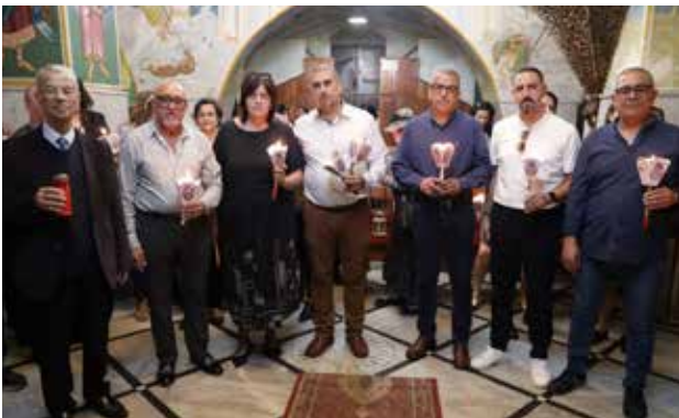
استقبال النور المقدس