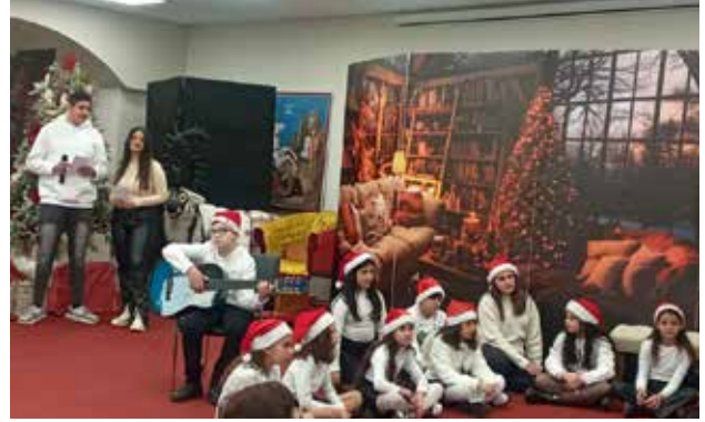
أطفال مدرسة الأحد في أمسية ميلادية