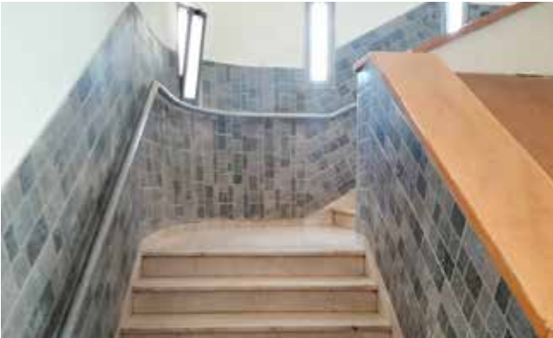
نادي مركز الأحداث الأرثوذكسي مدخل القاعة