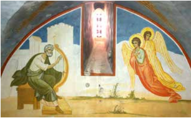
مراحل ترميم أيقونة النبي داوود