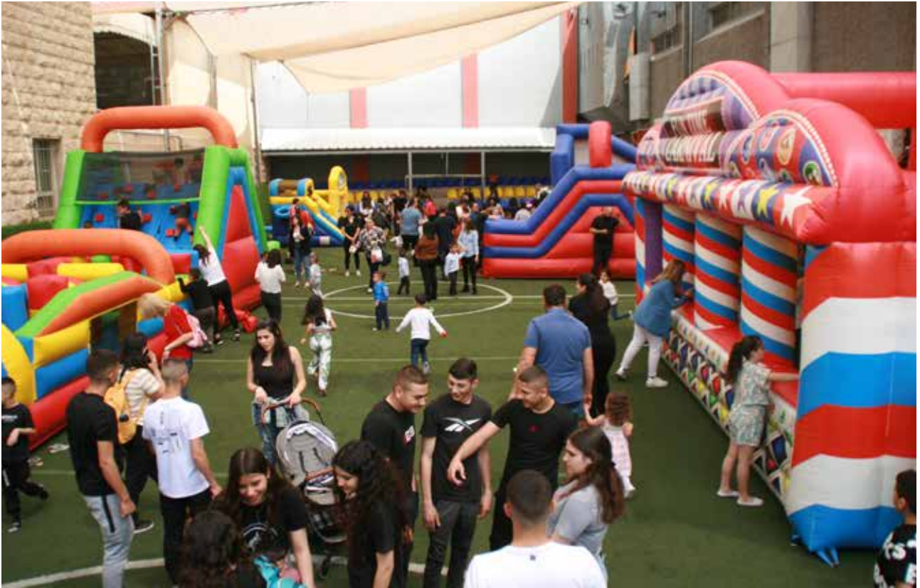
فعاليات الأطفال في موسم الفصح