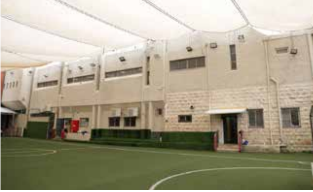
מبنى حضانة البشارة