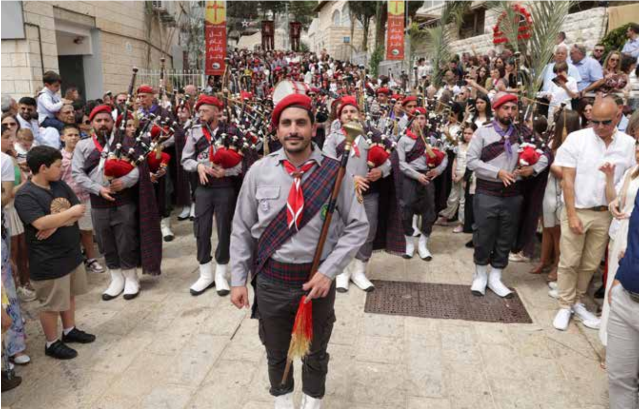
استعراض كشفي - أحد الشعانين