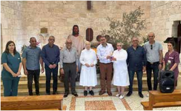
توزيع النور المقدس للمستشفى الفرنسي