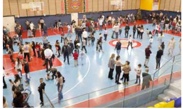
فعاليات الأطفال في موسم الميلاد