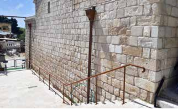
درج مدخل الكنيسة الخلفي