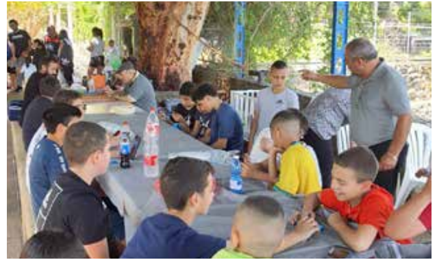
رحلات إلى الأماكن المقدسة