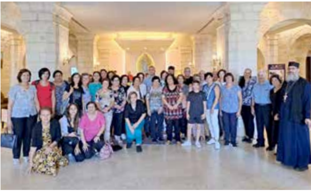
رحلات إلى الأماكن المقدسة