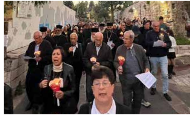
مسيرة الشموع الميلادية