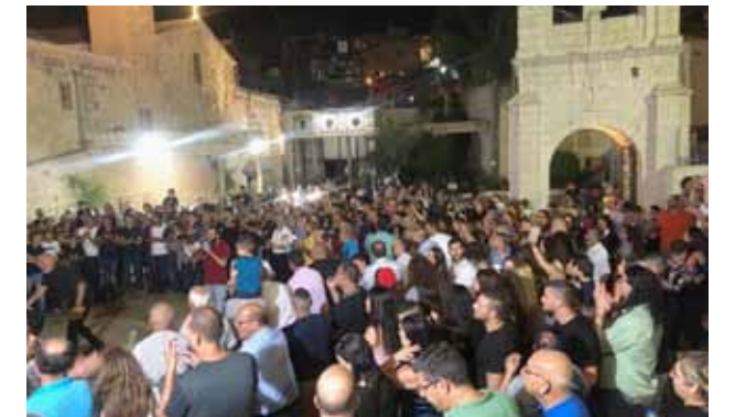
عيد العذراء 2019