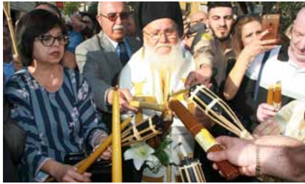
استقبال النور المقدس 2019