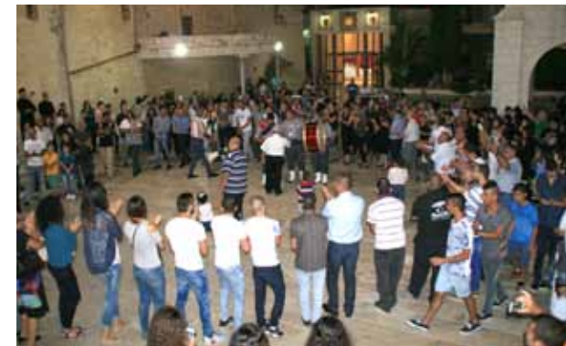
عيد العذراء 2019