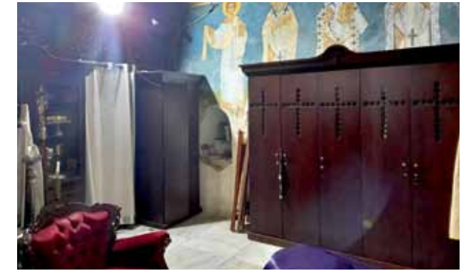
ترميمات في الهيكل وتركيب خزائن للكهنة