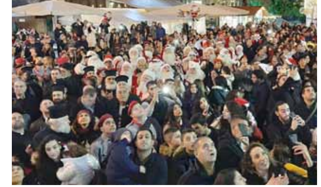
إضاءة شجرة بحضور فرقة سانتا العالمية