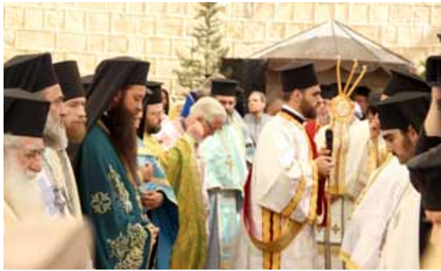
أحد الشعانين 2019