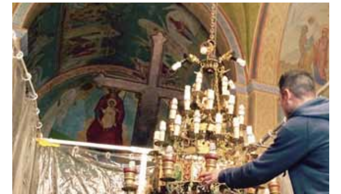
أعمال صيانة داخل الكنيسة