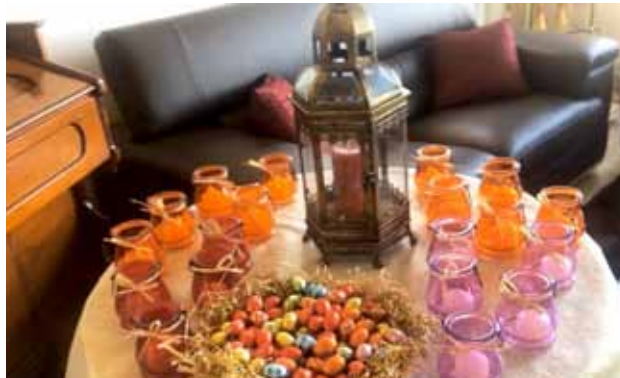
النور المقدس يصل إلى البيوت 2020