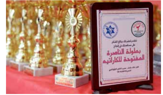
مركز الأحداث يحصل على المرتبة الأولى في مسابقة الكاراتيه