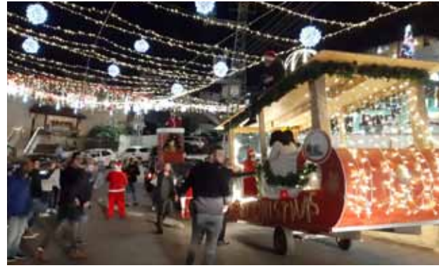
سيارة بابا نويل تجوب أحياء الناصرة 2020