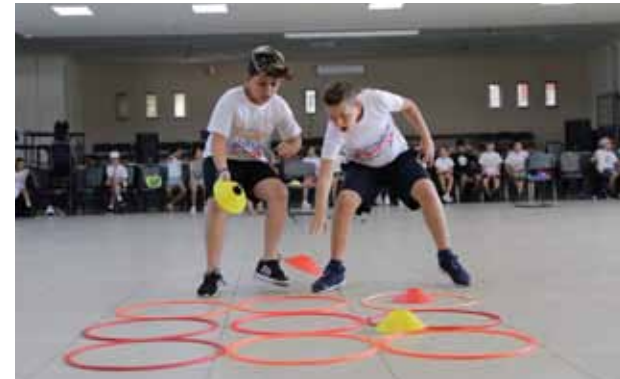
تمارين في مركز الأحداث