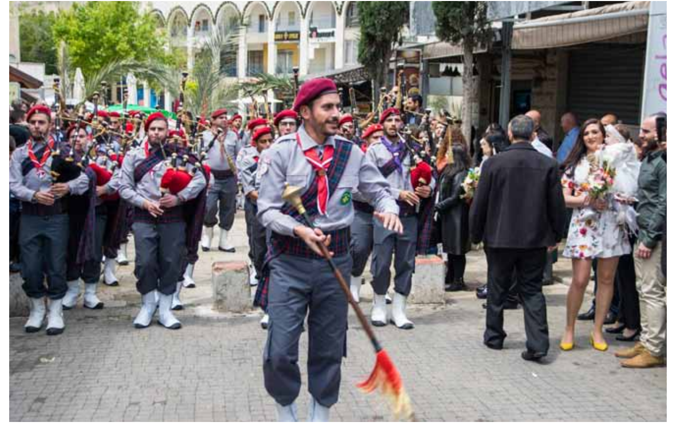
أحد الشعانين 2019