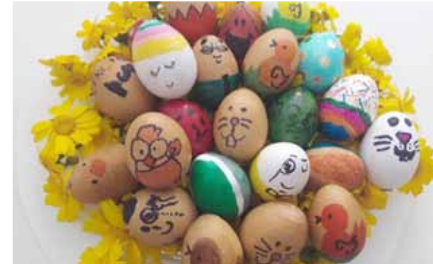
من مسابقة أجمل سلة بيض في عيد الفصح