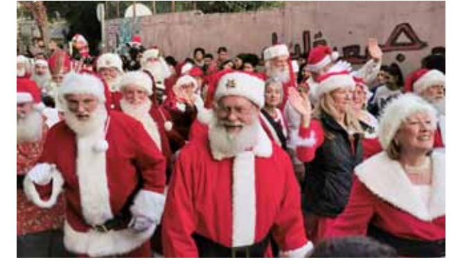
فرقة سانتا تشترك في مسيرة الميلاد الأرثوذكسية 2019