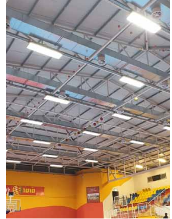
تركيب مكيفات ذات جودة وقوة عالية في قاعة الرياضة 2020