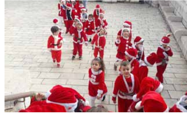
فعاليات الأطفال بعيد الميلاد المجيد