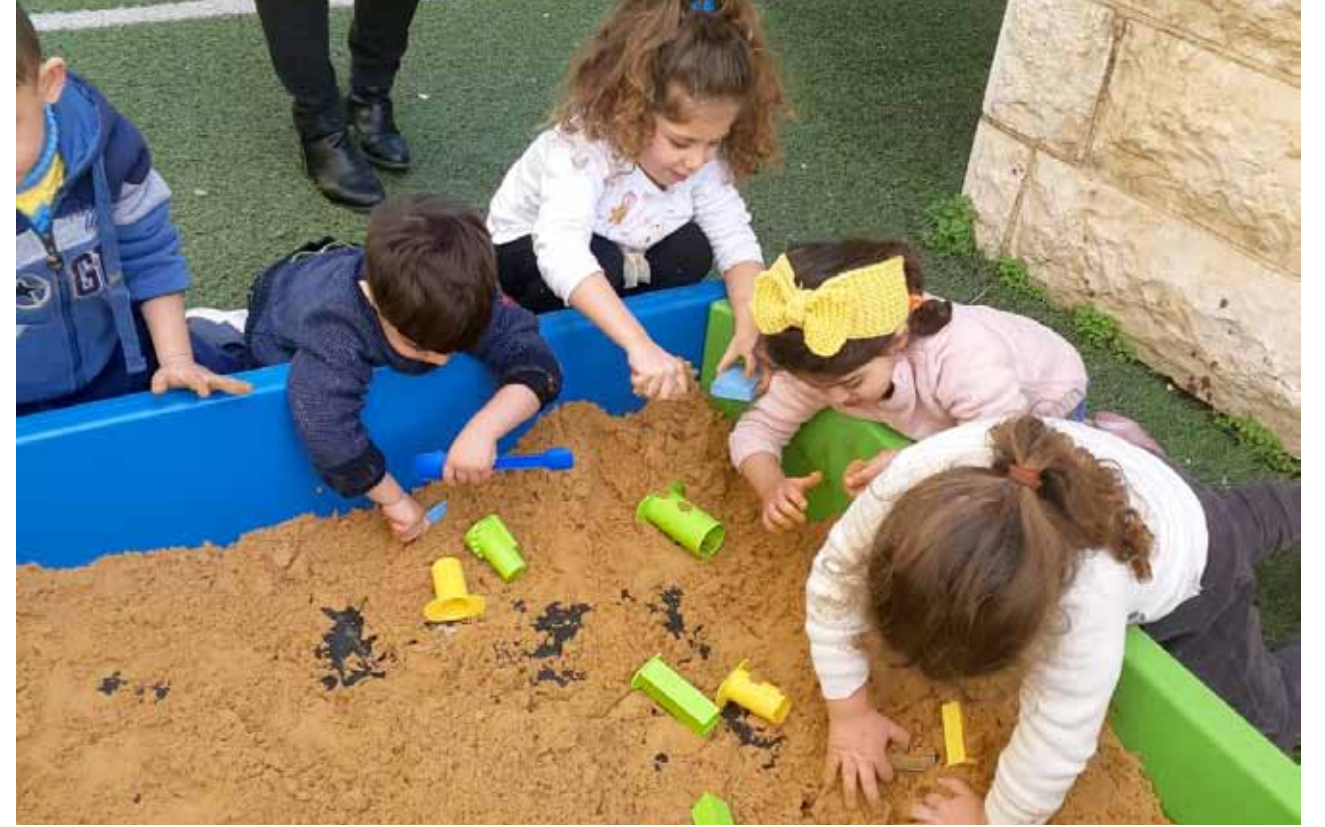
أطفال روضة البشارة يلعبون في الرمل