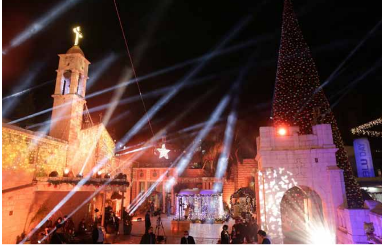
ليلة إضاءة شجرة الميلاد في ظل الكورونا 2020