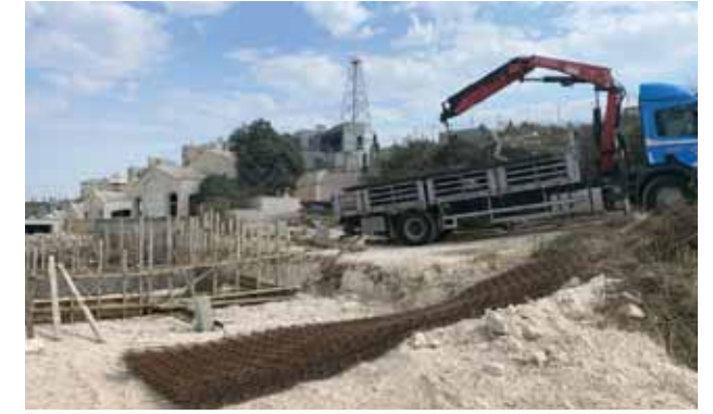
بناء جوارير في المدفن الجديد 2020