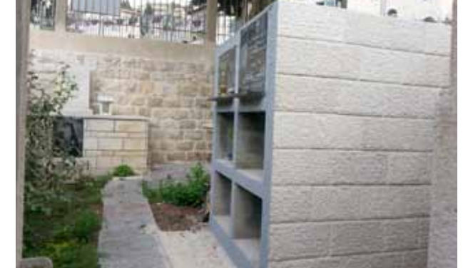
ترميم مدفن الكهنة خلف الكنيسة 2020