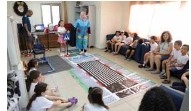
فعاليات تربوية لأطفال مركز الأحداث