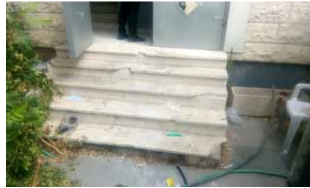
مدخل مقر الكشافة قبل الترميم