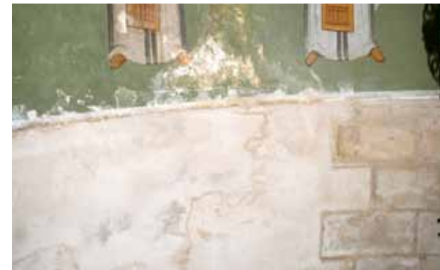
لاج للرطوبة داخل الهيكل