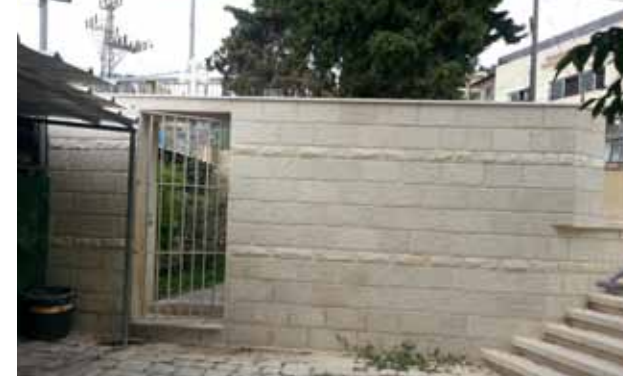
ترميم مدفن الكهنة خلف الكنيسة 2020