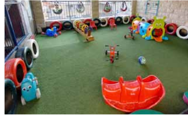
تزويد روضة البشارة بألعاب ساحة جديدة