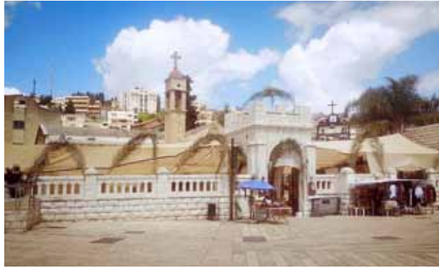
تزيين محيط كنيسة البشارة في أحد الشعاني