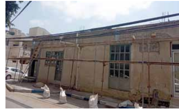
عمارة البشارة أثناء الترميمات 2020