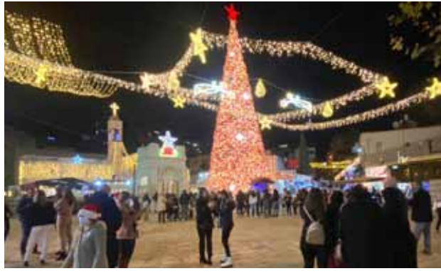
إضاءة شجرة الميلاد في ظل جائحة الكورونا 2020