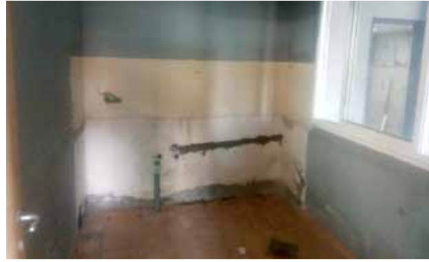
ترميمات أخرى في مقر الكشاف 2020