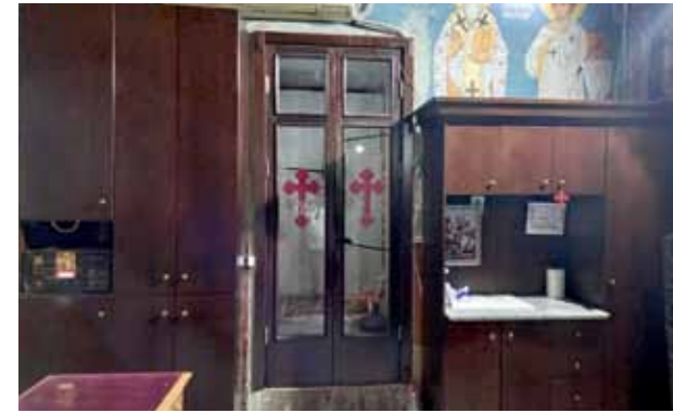
ترميمات في الهيكل وتركيب خزائن للكهنة