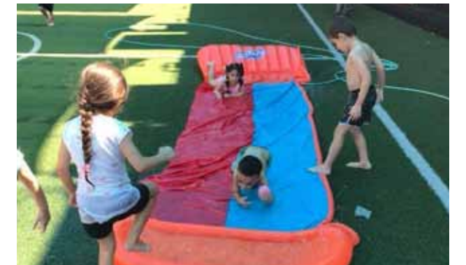
أطفال روضة البشارة وفعالية العاب مائية