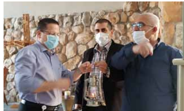
توصيل النور المقدس إلى المستشفى الإنجليزي 2020