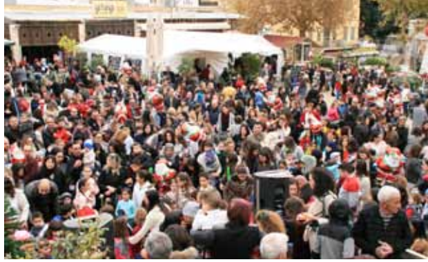
احتفال أهل الناصرة بإضاءة شجرة الميلاد 2019