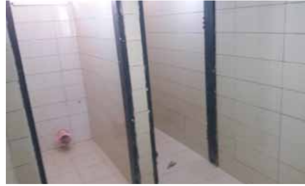
حمامات مقر الكشافة بعد الترميم 2020