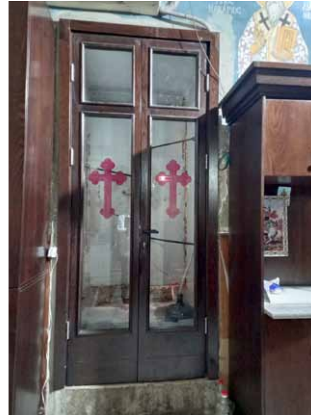
تركيب أبواب جديدة للكنيسة