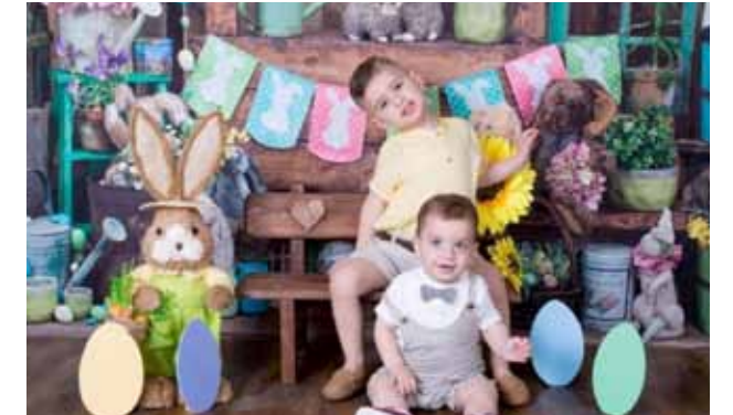
من مسابقة الأطفال في عيد الفصح