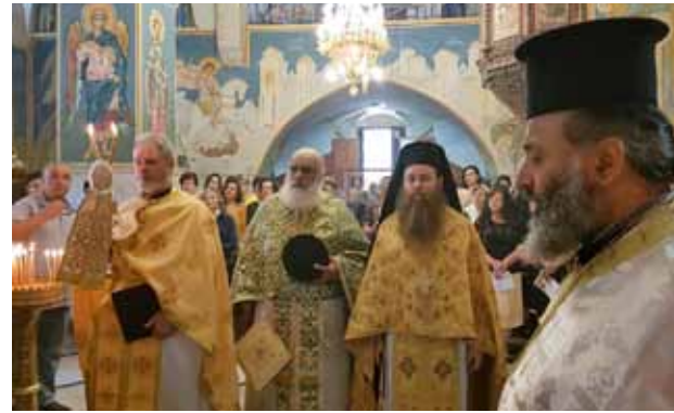
من صلوات عيد الفصح المجيد