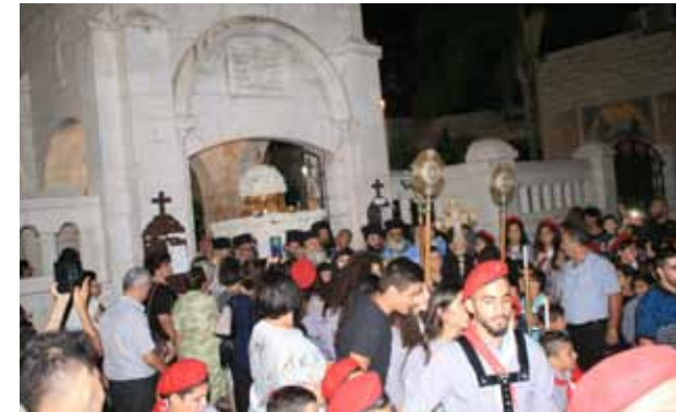
الجمعة العظيمة 2019