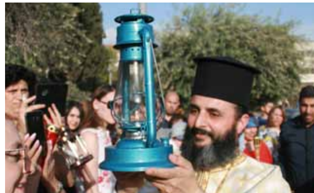
استقبال النور المقدس 2019