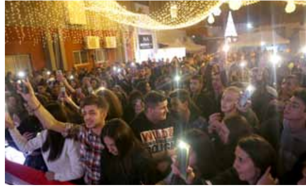
كريسماس ماركت 2019