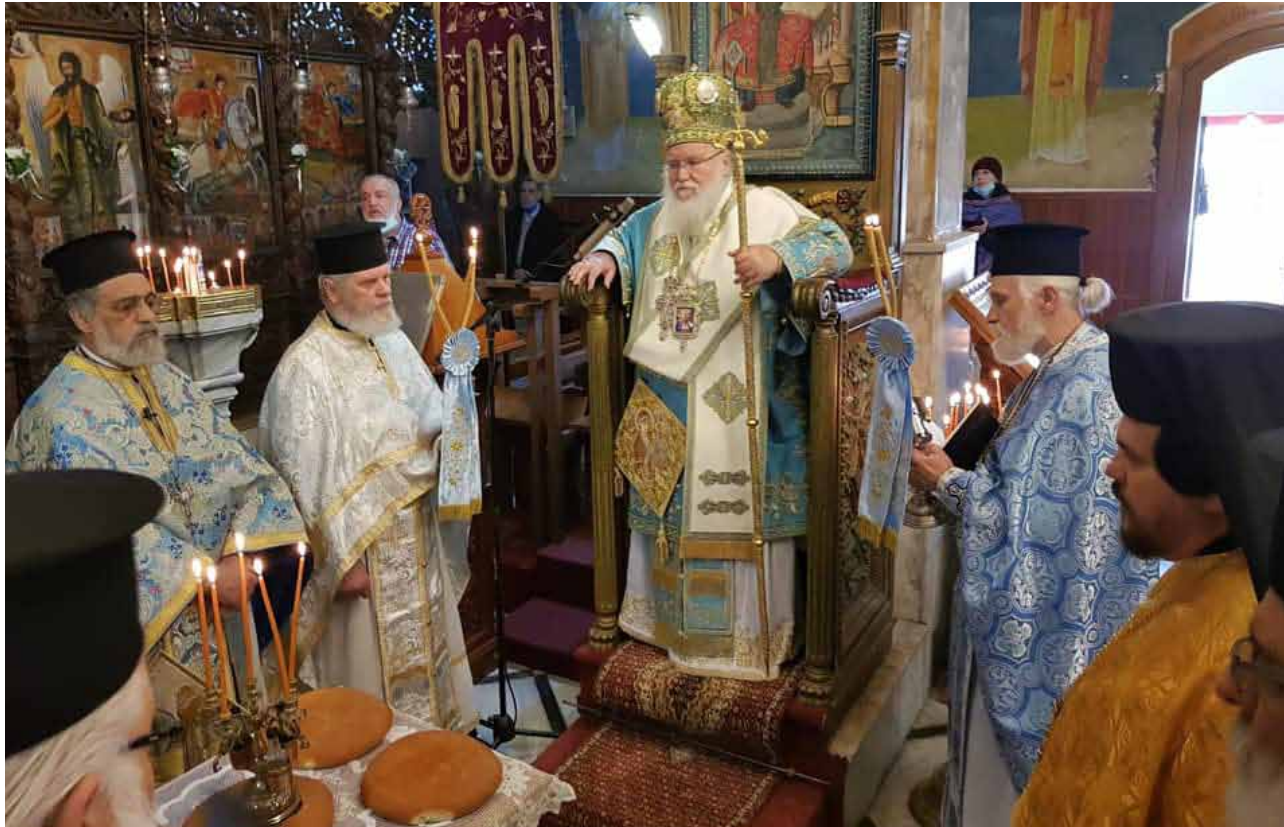
من صلوات عيد الفصح المجيد