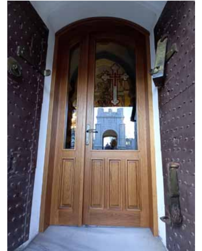
تركيب أبواب جديدة للكنيسة