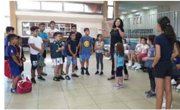
فعاليات أطفال مركز الأحداث