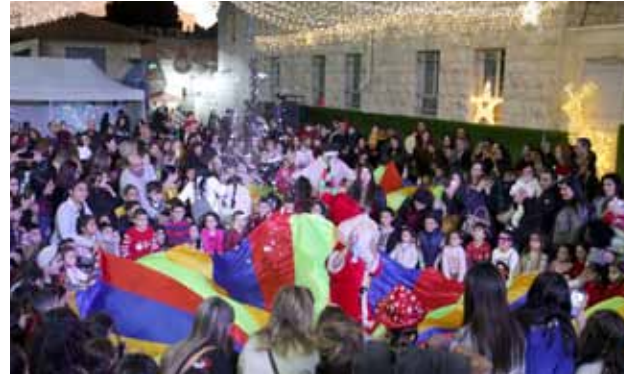
فعاليات للأطفال في كريسماس ماركت 2019