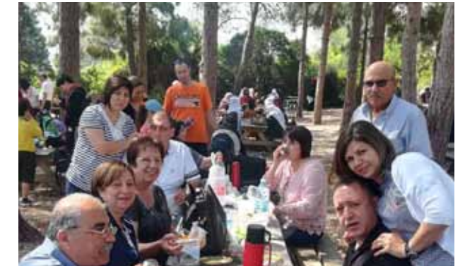
أعضاء النادي العائلي في رحلة استجمامية