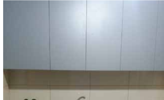
مطبخ مقر الكشافة بعد الترميم 2020