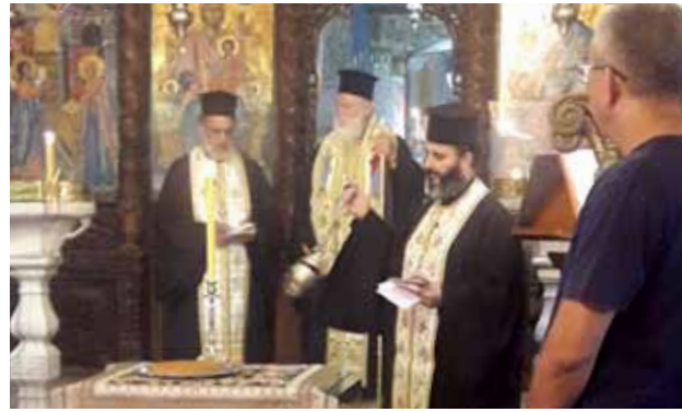
صلاة تضامن مع أهل بيروت بعد الحادثة التي ألت بهم 2020