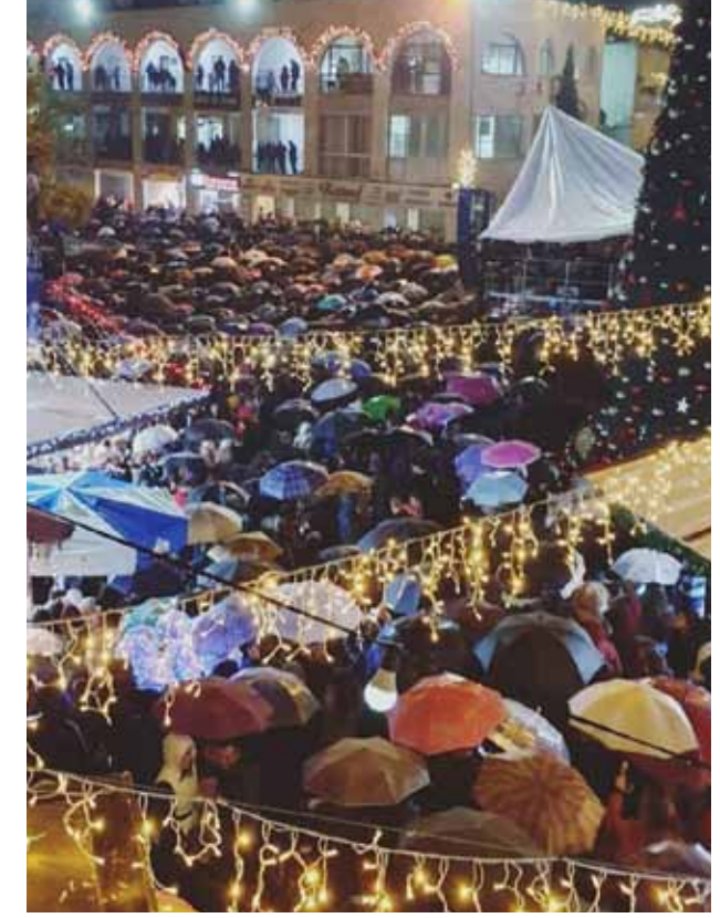
إضاءة شجرة الميلاد تحت وابل من المطر الغزير 2019