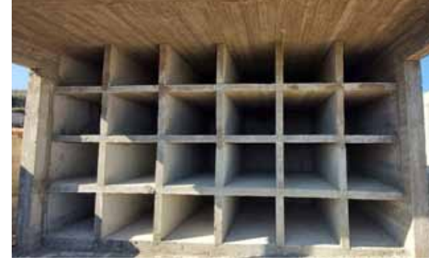
بناء جوارير في المدفن الجديد 2020