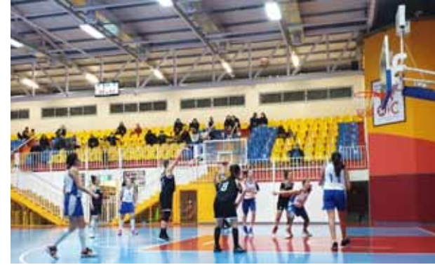
مباراة كرة سلة مع حضور ضئيل بسبب الكورونا