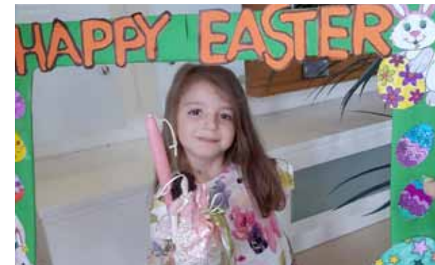
من مسابقة الأطفال في عيد الفصح