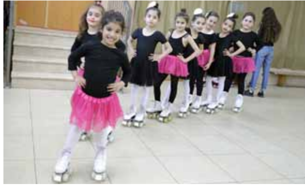
فرقة السكيت في مركز الأحداث