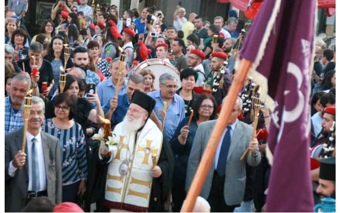
استقبال النور المقدس 2019