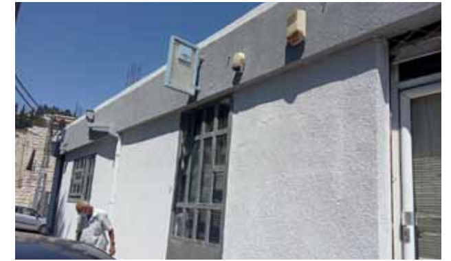
عمارة البشارة بعد الترميمات 2020