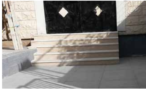
مدخل مقر الكشافة بعد الترميم 2020