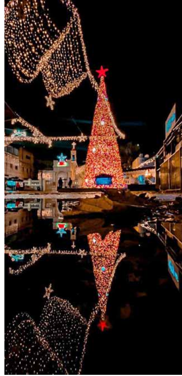
شجرة الميلاد وانعكاسها على ماء الشتاء