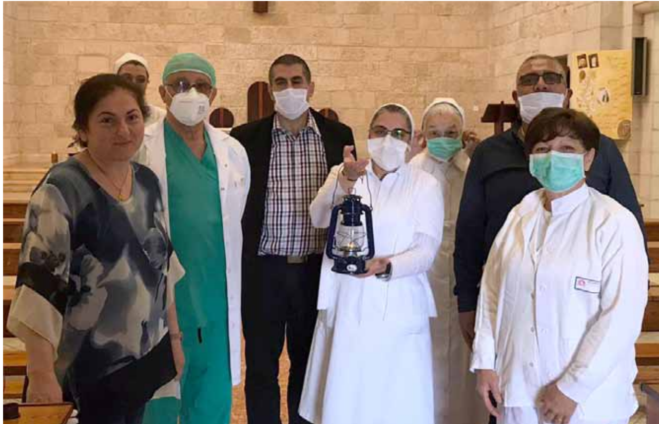
توصيل النور المقدس في ظل الكورونا إلى المستشفى الفرنسي 2020