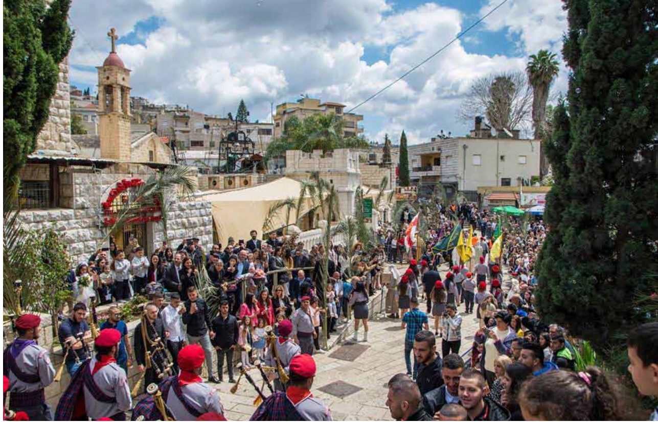
جانب من حضور مسيرة أحد الشعانين 2019