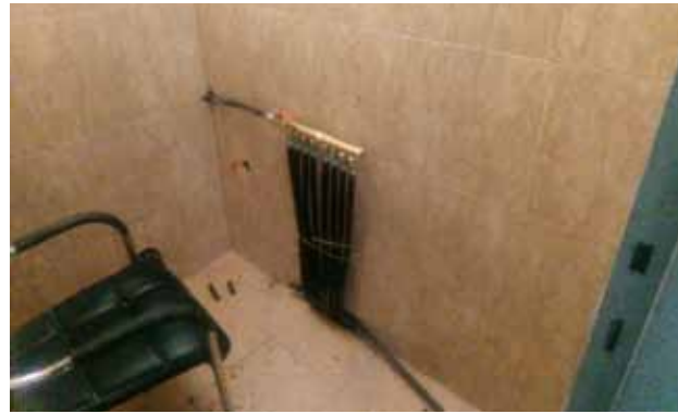
ترميمات أخرى في مقر الكشاف 2020