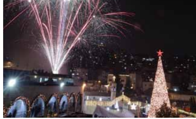
إضاءة شجرة الميلاد في ظل جائحة الكورونا 2020