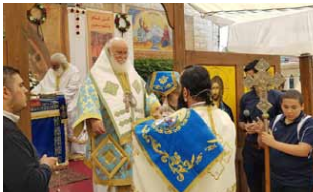
من صلوات عيد الفصح المجيد 2019