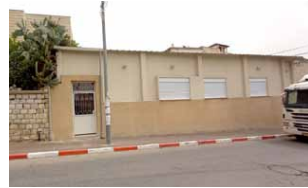
واجهة نادي المسنين بعد الترميم