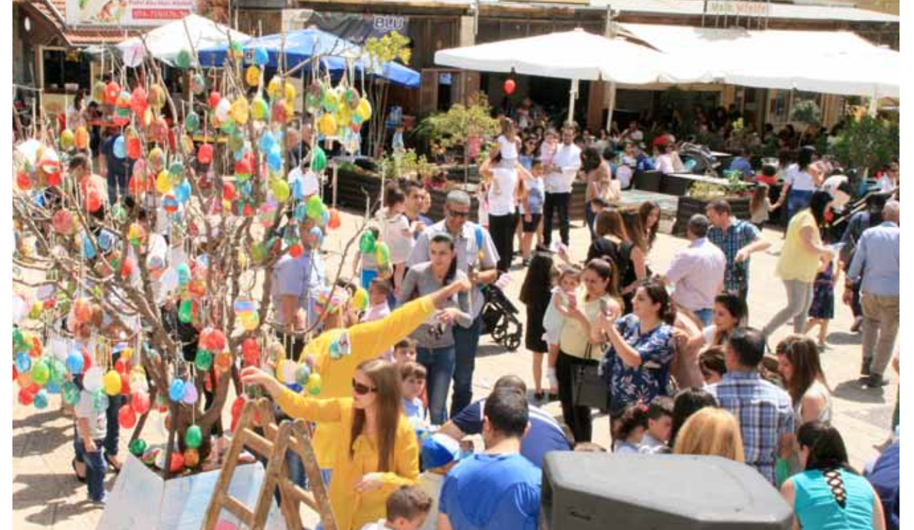
فعاليات للأطفال بعيد الفصح المجيد