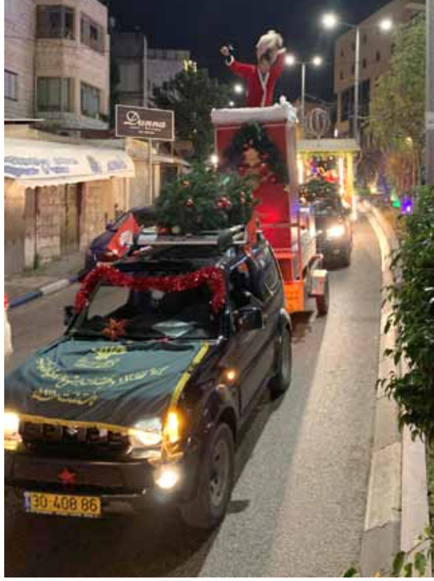
سيارة بابا نويل تجوب أحياء الناصرة 2020