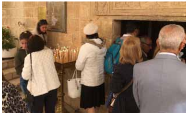
استقبال المصلين في اسبوع الآلام 2019