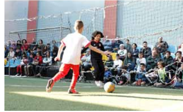
جانب من حضور لعبة كرة قدم مصغرة