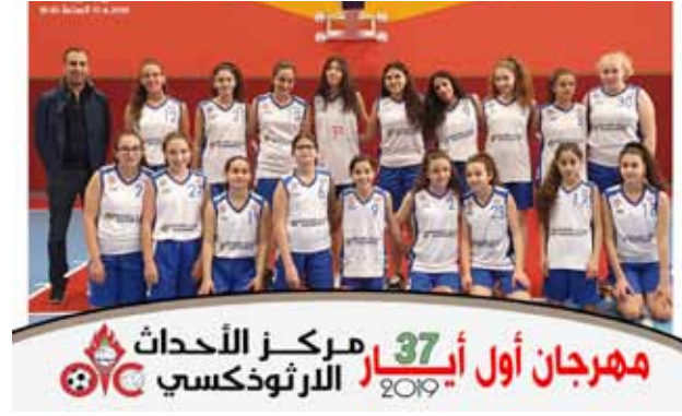
مهرجان الأول من أيار 2019