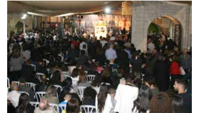
الجمعة العظيمة 2019