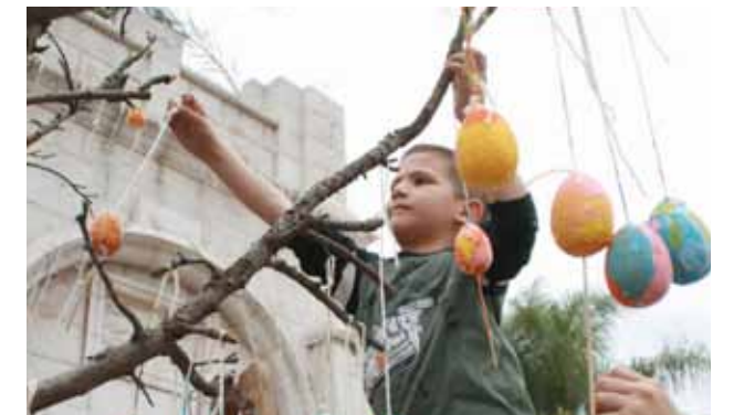
فعاليات للأطفال تزيين شجرة البيض