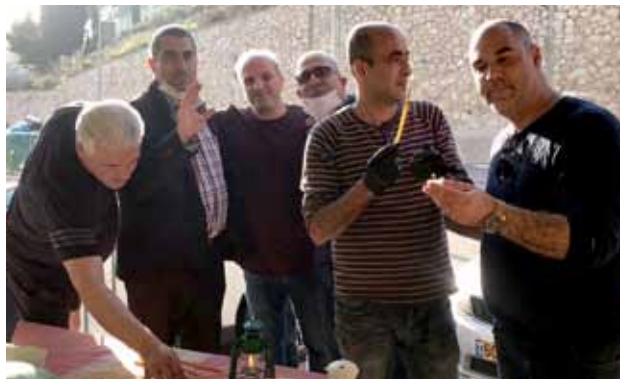
وصول النور المقدس إلى الأحياء 2020