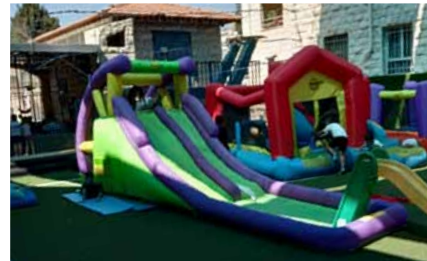
العاب نفخ في روضة البشارة