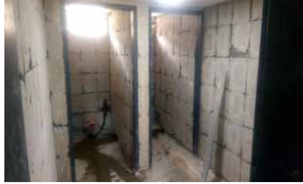
حمامات مقر الكشافة قبل الترميم