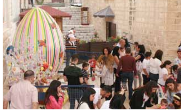
بيضة عيد الفصح العملاقة