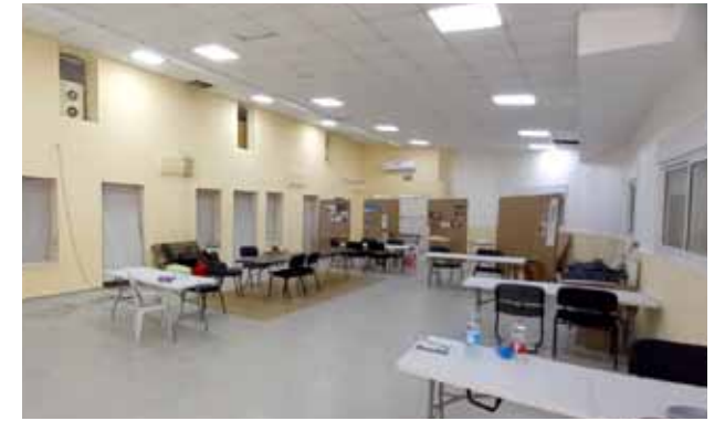
نادي المسنين بعد الترميم