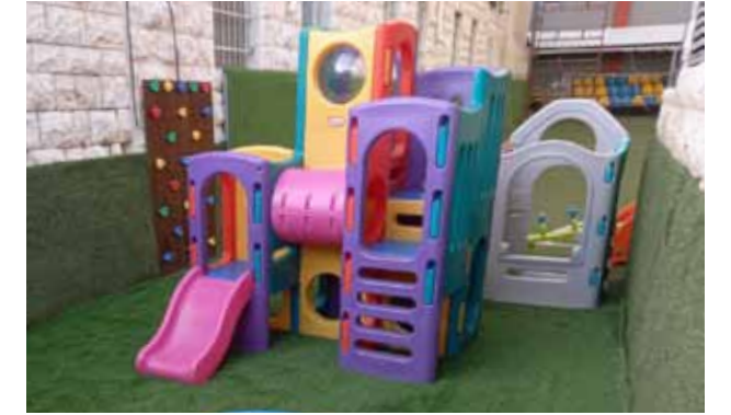
تزويد روضة البشارة بألعاب ساحة جديدة